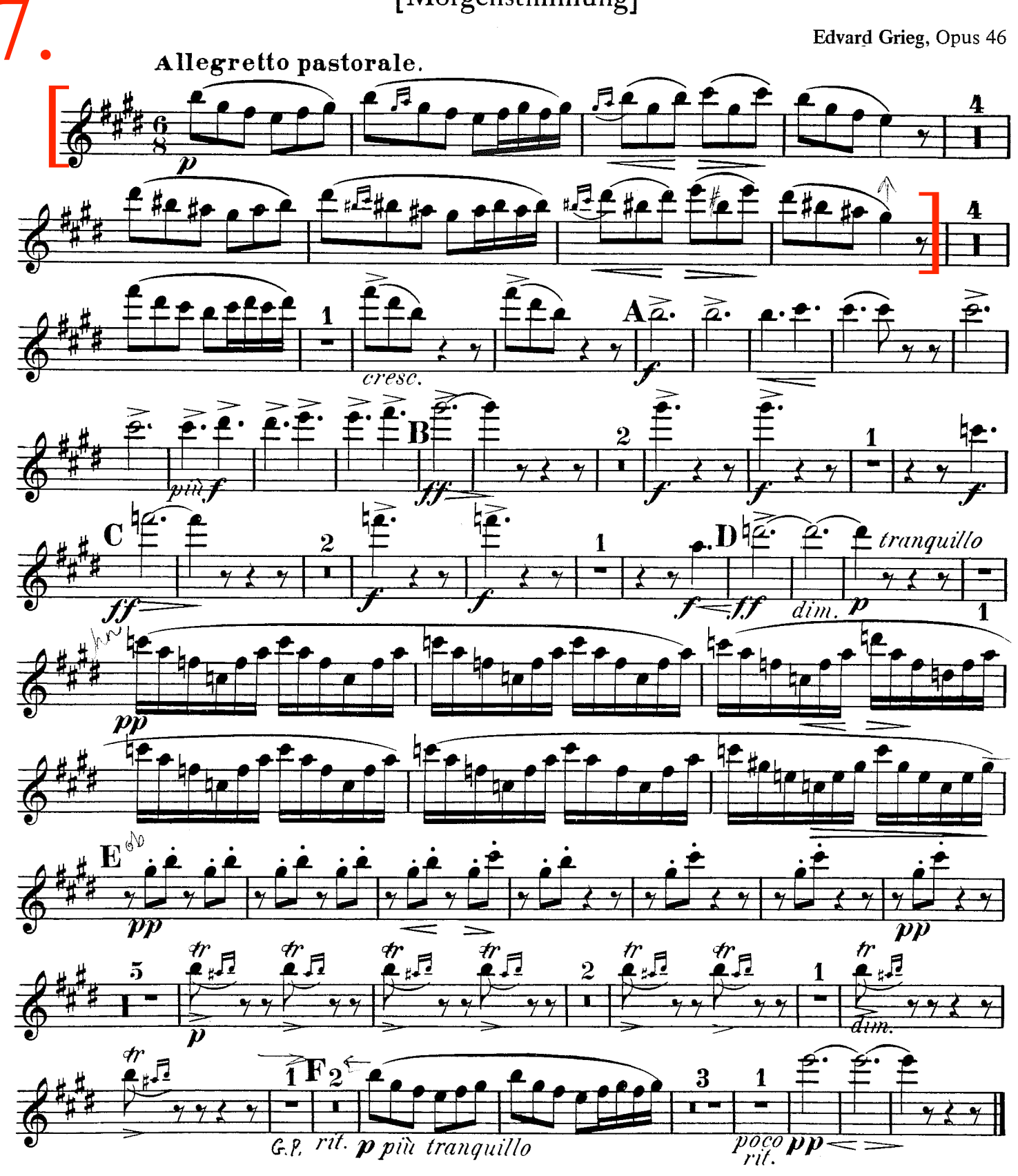
II, III - Tacit