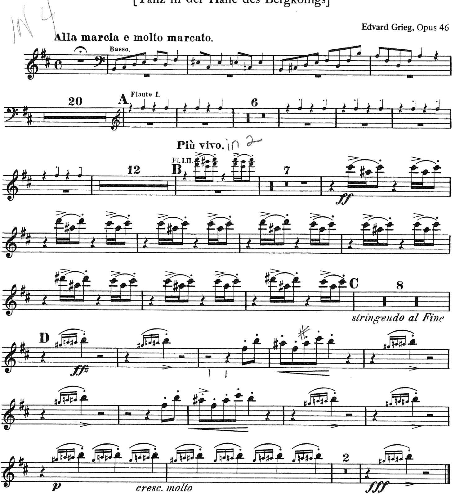
Luck's Music Library

IV - Dance in the Hall of the Mountain King [Tanz in der Halle des Bergkönigs]